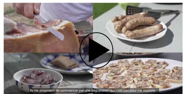
Diversité des produits